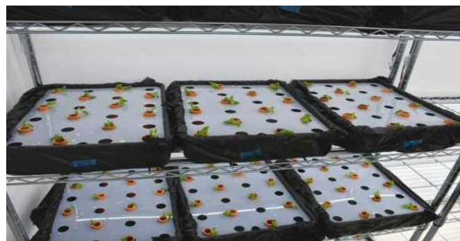
4月23日 1 2 株パレット栽培棚