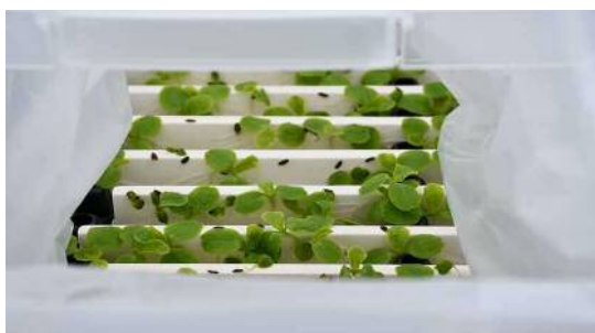
4月17日 移植前の成長状況