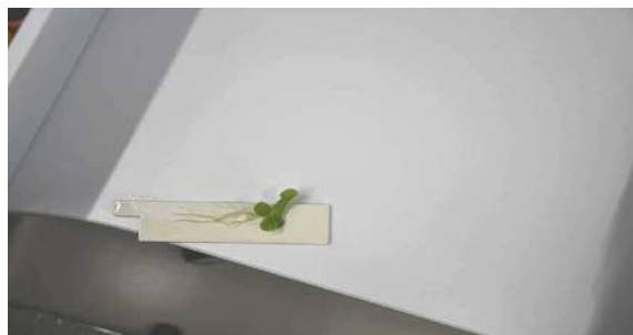
4月22日 育苗からの選定苗 (5週間管理)