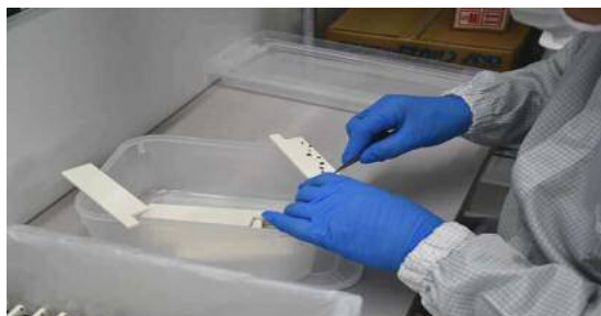
4月9日 セラミック板への播種 (2週間 育成棚)