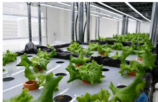
5月1日 栽培状況 (5月25日製品完成) 播種後7週間後