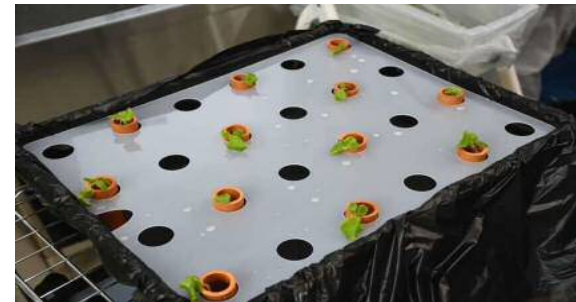
4月22日 移植苗 (円筒型セラミック) (栽培棚 5週間)