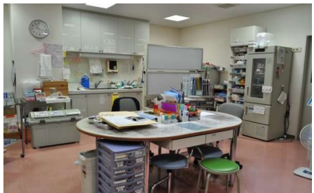
ナースステーション