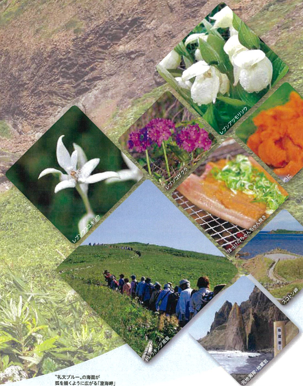
“礼文ブルー”の海面が 弧を描くように広がる「澄海岬」

「花の浮島」と称される礼文島。日本最北の国立公園「利尻礼文サロベツ国立公園」に含まれ、一島一町の美しい島です。本土から見ると利尻島よりも沖に位置する礼文島は、沖の島を意味するアイヌ語の「レブンシリ」に、その名を由来します。本州では、2,000m級の高山でしか見られない花々が、海拔ゼロメートルから目に出来ることから「花の浮島」と呼ばれており、春から夏にかけて島中が花で彩られ、この島でしか見られない「レブンアツモリソウ」などの固有種や、まちなかに指定されている「レブンウスユキソウ」など、雄大な自然によって育まれた約300種類にもおよぶ花が咲き誇ります。